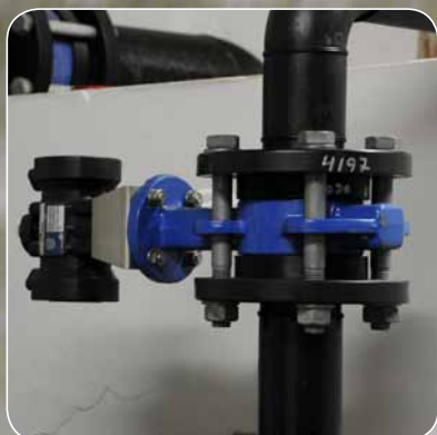
BRØNDBOREUDDANNEDE (A+B BEVIS)